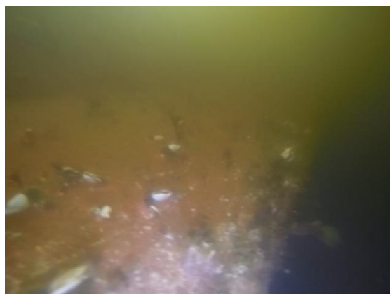
Figura 01: Bolina à boreste da embarcação Ilha das Flechas, sem registro de coral-sol.