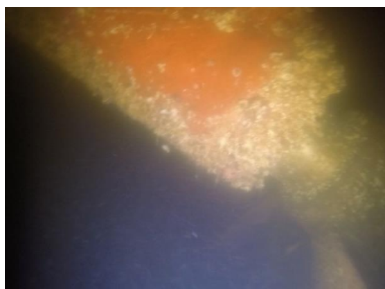
Figura 03: Tubulão à bombordo da embarcação Ilha das Flechas, sem registro de coral-sol.