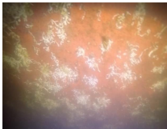
Figura 02: Fundo à boreste da embarcação Ilha das Flechas, sem registro de coral-sol.